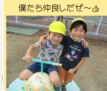
僕たち仲良しだぜ〜♡