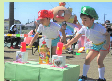
マリオとルイーダに変身★