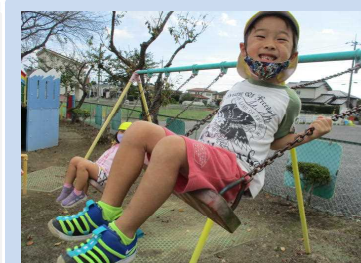
いい笑顔♡楽しそうだね！