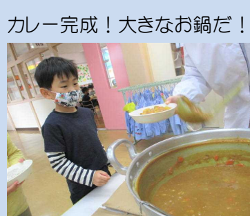
カレー完成！大きなお鍋だ！