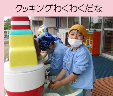
クッキングわくわくだな