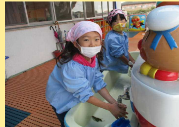
ジャガイモ綺麗に洗うよ☆