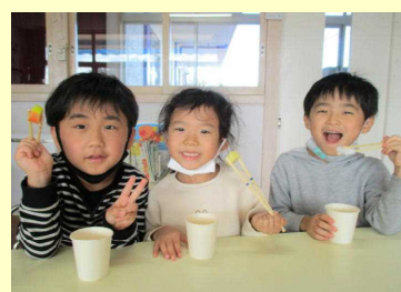
遊びながらお箸練習★