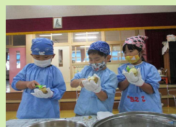
丁寧に皮むきするよ！