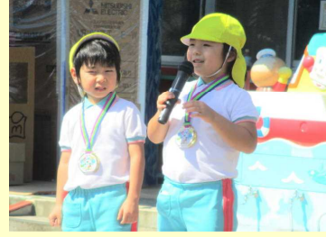
終わりの言葉よく言えました