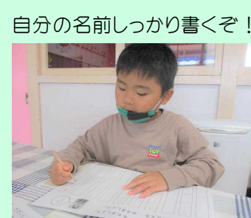
自分の名前しっかり書くぞ！