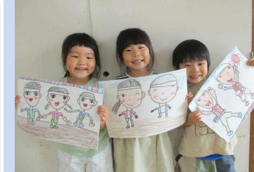
一生懸命描きました♡