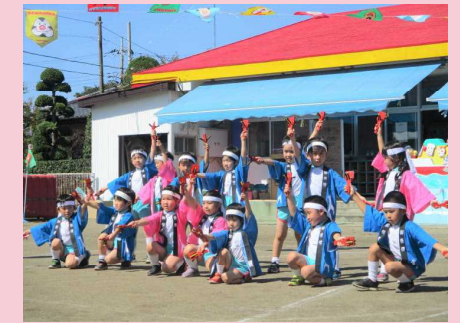
みんなとてもかっこよかったね！