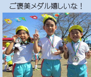
ご褒美メダル嬉しいな！