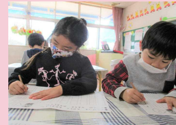
午後の学びの時間です☆